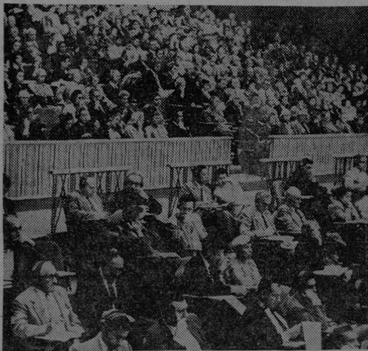
La sección de prensa —al frente— y la galería para el público —atrás— del Comité Político de la O. N. U. están siempre ocupadas hasta el máximo, como indicio evidente del interés que se advierte por conocer los trabajos de la organización.

Tanto el desfile como el festival fueron presenciados por el secretario de Relaciones Exteriores, Luis Padilla Nervo; por el secre-