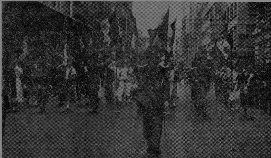
Un brillante desfile, en el que intervinieron cadetes de los colegios militares y alumnos de diversas escuelas de la capital se efectuó en la ciudad de México para celebrar el Día de las Naciones Unidas.