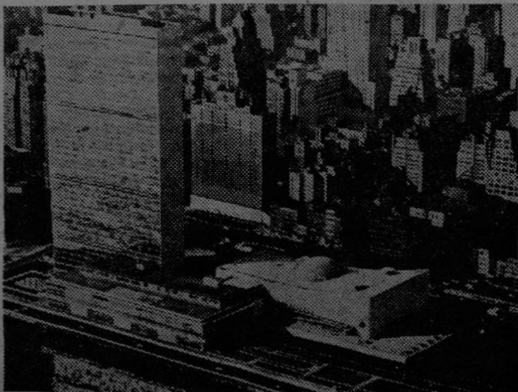
El rascacielos del secretariado de la O. N. U. se levanta a orillas del río del Este, en Nueva York. El edificio blanco, con una cúpula es el de la Asamblea General.