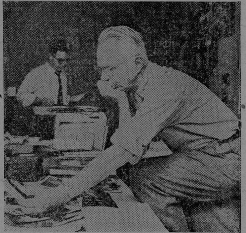
Edward Steichen, director del Departamento de Fotografía del Museo de Arte Moderno de Nueva York, aparece aquí junto con su ayudante, el conocido fotógrafo norteamericano Wayne Miller, mientras ambos preparaban la exposición de "La Familia del Hombre".

CIUDAD DE MEXICO.—Edward Steichen, el maestro de la fotografía de los Estados Unidos, ha demostrado que la cámara fotográfica, en manos de una persona sensible, observadora, es capaz de producir obras de arte iguales a las más grandes de la pintura y la escultura.