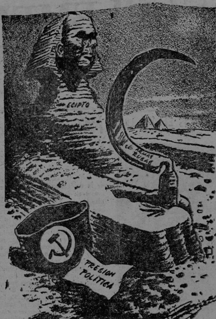
De "LOS ANGELES TIMES", de Los Angeles, California.

"Si vamos a gozar de los frutos del automatismo en el futuro próximo, tendremos que usar la inteligencia y la previsión para evitar los desajustes".